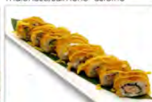
77 MAKI FRITTO 5.50€ salmone avocado, philadelphia salsa maionese piccante