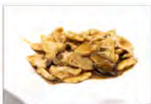
166 MAIALE CON BAMBU E FUNGHI 5.50€