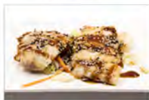
129 BRANZINO ALLA GRIGLIA 5,50€