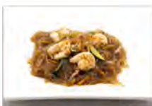
179 SPAGHETTI DI SOIA CON GAMBERI E VERDURE 5.50€