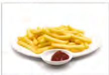
152 PATATINE FRITTI 5.50€