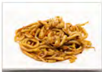
107 YAKI UDON CON GAMBERI 5.50€ spaghetti udon con verdure e gamberi