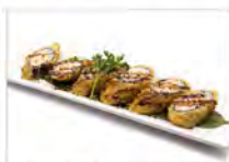
99 HOSOMAKI FRITTO 5.50€ salmone