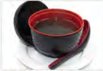
23 OSU MASHI 5,50€ surimi,gamberi,alghe,cipolle