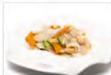
174 GNOCCHI DI RISO CON VERDURE E GAMBERI 5.50€