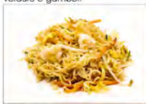
112 RAMEN SALTATO 5.50€ spaghetti "ramen" saltato con verdure