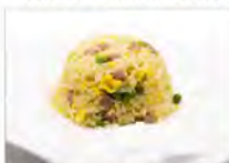
122 RISO CANTONESE 5.50€