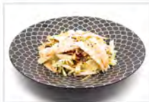
17 EBI 5,50€ gamberi cotti