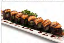
79 BLACK TIGER 5.50€ riso venere integrale, gamberi tempura, avocado, salmone salsa