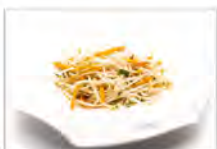
183 GELMOI SOIA SALTATI 5.50€