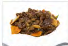
171 MANZO CON VERDURE 5.50€