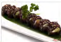
64 BLACK ROLL 5.50€ salmone, avocado, philadelphia