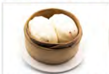
147 PANE CINESE DOLCE 5PZ 5.50€