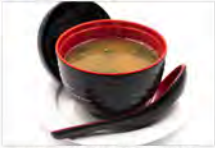
22 MISO SHIRO 5,50€ alghe,toufu,cipolle