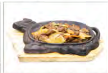
173 MANZO ALLA PIASTRA 5.50€