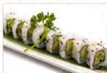
63 VEGETALE 5.50€ avocado e cetriolo