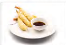
135 TEMPURA EBI 4PZ 5.50€ gamberi