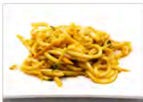
108 INDIAN UDON 5.50€ spaghetti udon al curry