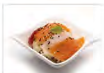
105 CIRASHI MISTO 5.50€ riso con pesce crudo