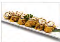
100 HOSSO FRITTO PHILADELPHIA 5.50€ philadelphia