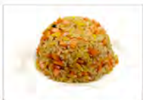
117 RISO SALTATO CON SALMONE 5.50€