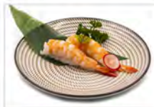
40 EBI 4PZ 5.50€ gambero cotto