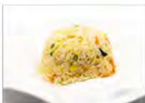
118 RISO SALTATO CON VERDURE 5.50€