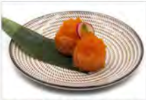
35 SALMONE TOBIKO 3PZ 5,50€ bigne di riso avvolto in salmone con tobiko