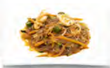
181 SPAGHETTI DI SOIA PICCANTE CON GAMBERI E VERDURE 5.50€