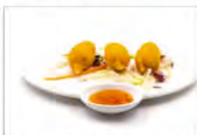
149 CHELE DI GRANCHIO 5PZ 5.50€