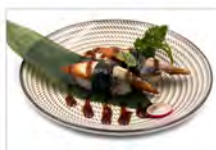
43 ANGUILLA 4PZ 5.50€