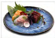
49 SASHIMI MISTO 5.50€