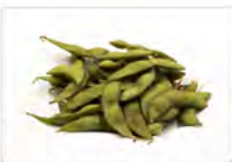
2 EDAMAME 5,50€ fagiolini di soia