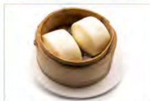
146 PANE CINESE 5PZ 5.50€