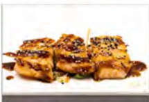
128 SALMONE ALLA GRIGLIA 5,50€