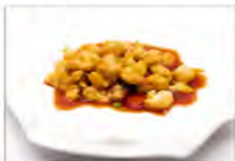
163 POLLO AGRODOLCE 5.50€