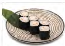
96 EBI 5.50€ gambero cotto