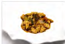
159 POLLO IN SALSA PICCANTE 5.50€