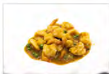
142 GAMBERI SALSA COCCO 5.50€