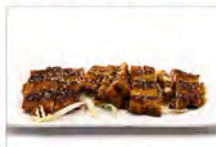
133 TONCATSU 5.50 € cotoletta di maiale