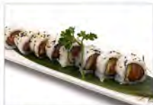
54 SALMONE AVOCADO 5.50€ salmone, avocado