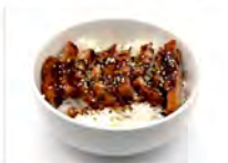
114 KATSU DON 5.50€ ciotolla di riso con cotoletta di maiale