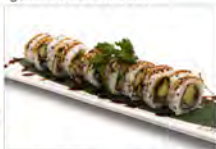
56 UNAGHI 5.50€ anguilla, avocado, teriyaki