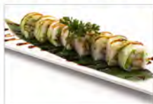
66 NEW CHICKEN ROLL 5.50€ alga di riso, riso, insalata, Maio, avocado, pollo fritto