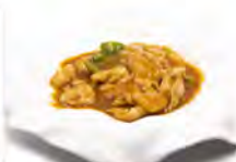
144 POLLO SALSA THAIANDESE 5.50€