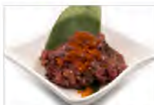
10 TONNO TARTAR 5,50€