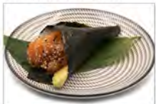
81 SALMONE AVOCADO 5,50 salmone e avocado