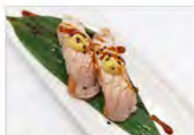
47 SAKE FLAMBE 4PZ 5.50€