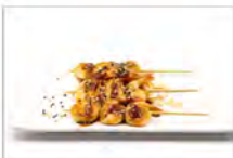
125 YAKI EBI 3PZ 5.50€ spiedini di gamberi