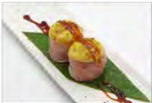
31 GUNKAN DOLCE 3PZ 5,50€ salmone scottato con salsa e pistacchi