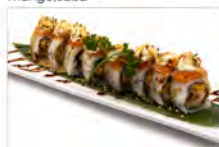
75 COSMO ROLL 5.50€ salmone fritto, salmone, philadelphia, salsa