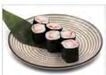
97 SURIMI 5.50€