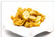
160 POLLO AL LIMONE 5.50€