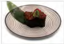
30 GUNKAN IKURA 3PZ 5,50€ uova di salmone