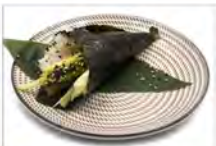
85 AVOCADO CETRIOLO 5,50 avocado e cetriolo