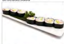
90 CALIFORNIA 5.50€ surimi, avocado