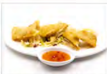
3 HARUMAKI 3PZ 5,50€ involtini giapponesi