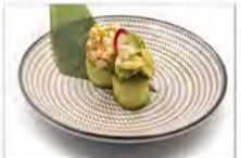
33 GUNKAN EBI 3PZ 5,50€ bigne di riso avvolto in cetriolo con gambero cotto e avocado, maionese,tobiko