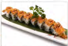
74 SUPER TIGER 5.50€ tempura di gamberoni, basilico, maionese/salmone esterno