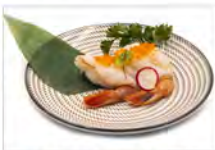
42 AMAEBI 4PZ 5.50€ gamberetti rossi crudi