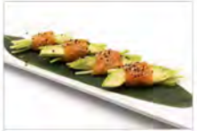
26 INVOTINO DI SALMONE 3PZ 5,50€ cetriolo, avocado, salmone