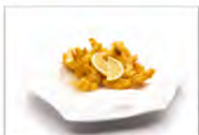
156 GAMBERI LIMONE 5.50€