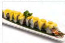
72 MANGO ROLL 5.50€ tempura di gamberoni, maionese mango, salsa