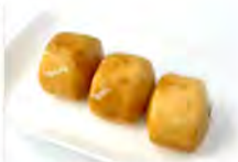
309 PANE FRITTO 5.50€