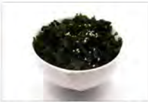
21 INSALATA DI ALGHE 5,50€ insalata di alghe con salsa di sesamo