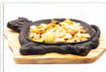
164 POLLO ALLA PIASTRA 5.50€