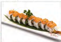
73 TIGER ROLL 5.50€ tempura di gamberoni, maionese salmone esterno e salsa