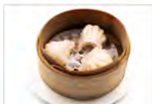
7 DIM SUM EBI 5PZ €5.50 gamberi, zenzero