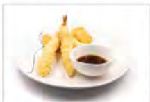
134 TEMPURA MIX 4PZ 5.50€