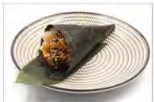
84 SPICY SALMON 5,50 tartare salmone, salsa piccante, tobiko