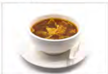
153 ZUPPA AGROPICCANTE 5.50€