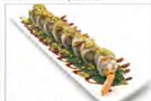
306 PISTACHIO ROLL 5.50€ maionese e gambero fritto/ salsa e pistachio