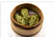
8 DIM SUM VERDE SPINACI 5PZ €5.50 verdure miste