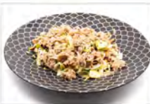
18 TONNO AVOCADO 5,50€ tonno cotto, avocado