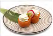
32 GUNKAN WHITE 3PZ 5,50€ bigne di riso avvolto in salmone con philadelphia, sesamo,salsa