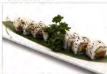
55 PHILADELPHIA 5.50€ Salmone, avocado, philadelphia