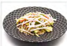
16 CALIFORNIA 5,50€ surimi, avocado