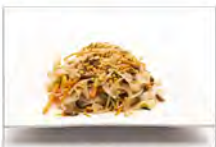
140 SPAGHETTI THAILENDESE 5.50€ saltati con manzo e verdure