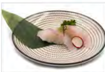
39 SUZUKI 4PZ 5.50€ branzino