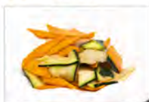
182 VERDURE SALTATE 5.50€