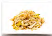
177 SPAGHETTI DI RISO CON FRUTTI DI MARE 5.50€