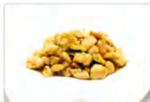
162 POLLO CON MANDORLE 5.50€