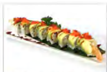
307 DRAGON ROLL 5.50€ gambero fritto, phila, esterno avocado tobiko e salsa