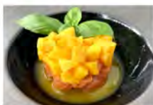
308 TARTAR MANGO SALMON 5,50€ tartar di salmone con mango, salsa tropicale.