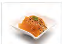
104 CIRASHI SAKE 5.50€ riso, con salmone crudo