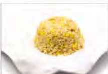
141 RISO SALTATO ANANAS 5.50€