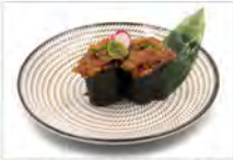
28 GUNKAN TONNO 3PZ 5,50€ tartare tonno con maionese, salsa piccante,tobiko