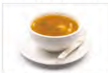
139 ZUPPA THAILENDESE 5.50€