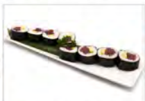
91 TONNO 5.50€ tonno avocado