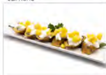
102 HOSSO FRITTO MANGO 5.50€ phila, mango