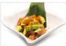
11 SALMONE TARTAR AVOCADO 5,50€