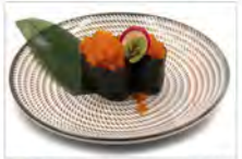
29 GUNKAN TOBIKO 3PZ 5,50€ uova di pesce volante