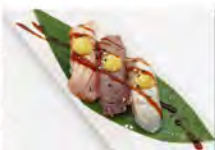
46 FLAMBE MISTO 4PZ 5.50€