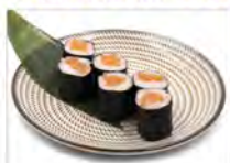
93 SAKE 5.50€ salmone