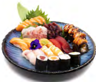
S4 BARCA GRANDE 33PZ €28,00 12 nighiri 13 sashimi 4 uramaki 4 hossomaki