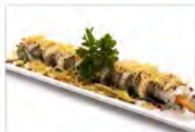
51 EBITEN 5.50€ gambero fritto, maionese, salsa