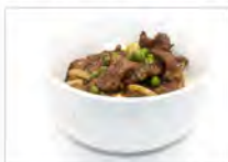
115 NIKU DON 5.50€ ciotolla di riso con manzo saltato