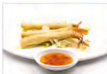
1 STICK DI GAMBERI 4PZ €5,50 gamberi e cipollina