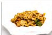
167 MAIALE IN SALSA PICCANTE 5.50€