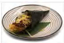
80 EBITEN 5,50 tempura di gambero