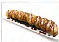
89 FUTOMAKI FRITTO 5.50€ salmone, surimi, avocado, philadelphia