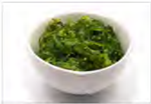
20 GOMA WAKAME 5,50€ insalata di alghe giapponese