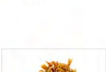
155 GAMBERI SALE E PEPE 5.50€