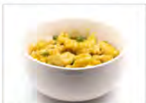
113 CURRY DON 5.50€ ciotolla di riso con pollo al curry saltato