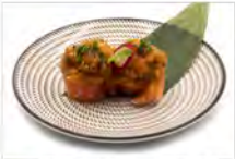
34 SPICY SALMON 3PZ 5,50€ bigne di riso avvolto in salmone, tartare di salmone spicy,tobiko