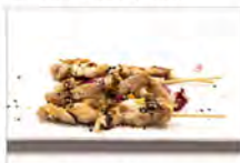
126 YAKI TORI 3PZ 5.50€ spiedini di pollo