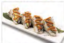
67 TONNO 5.50€ tonno cotto, maionese, salsa rosa, riso soffitato