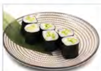
95 KAPPA 5.50€ cetriolo