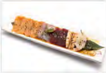
25 CARPACCIO MISTO 8PZ 5,50€