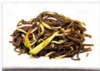
109 YAKI SOBA 5.50€ spaghetti grano saraceno con verdure e gamberi