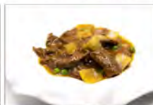
170 MANZO AL CURRY 5.50€