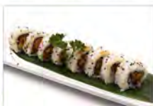
58 SPICY TUNA 5.50€ tartare tonno, salsa piccante, tobiko