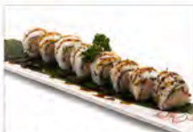
61 MIURA MAKI 5.50€ salmone alla griglia, insalata, philadelphia