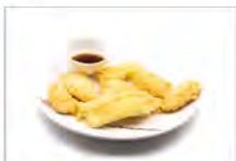
137 YASAINO TEMPURA 4PZ 5.50€ verdure