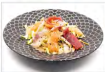
19 INSALATA MISTA 5,50€ Insalata Mista con Pesce Misto Crudo