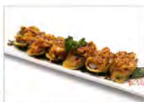
101 HOSSO FRITTO SPICY SALMON 5.50€ phila, tartar di salmone piccante