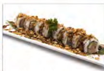
70 TUNA ROLL 5.50€ tonno cotto, philadelphia, avocado salsa e cipolla fritto