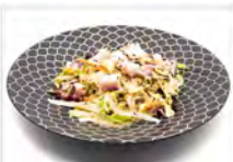
15 TAKO 5,50€ polipo