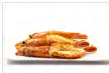
124 GAMBERONI ALLA GRIGLIA SPICY 3PZ 5.50€