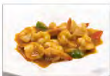
143 GAMBERI SALSA THAIANDESE 5.50€