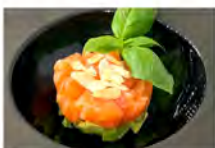
12 SALMONE TARTAR SPECIALE 5,50€ salmone, avocado