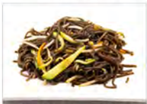
110 YAKI SOBA CON VERDURE 5.50€ spaghetti grano saraceno con verdure miste