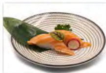
37 SAKE 4PZ 5.50€ salmone