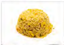
119 RISO AL CURRY CON POLLO E VERDURE 5.50€