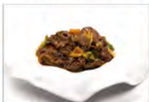
169 MANZO PICCANTE 5.50€