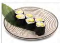
98 AVOCADO 5.50€