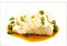
13 DOUFU 5,50€ formaggio di soia con salsa di soia e cipollotto