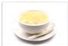
154 ZUPPA POLLO E MAIS 5.50€