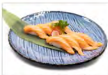
45 SUSHI SALMONE 11.00€ 8 pezzi