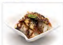
103 CIRASHI ANGUILLA 5.50€ Riso, Anguilla, salsa