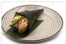
86 CALIFORNIA 5,50 maionese, surimi di granchio, gambero cotto e tobiko