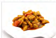
165 MAIALE CON SALSA AGRODOLCE 5.50€