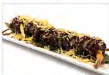
65 KYO ROLL 5.50€ tempura di gambero, maionese, patatine e salsa