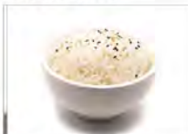
121 GOHAN 5.50€ riso bianco