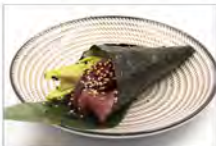
82 TONNO AVOCADO 5,50 tonno e avocado