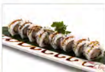
59 CRAB ROLL 5.50€ tempura di granchio, maionese, salsa