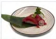
38 MAGURO 4PZ 5.50€ tonno