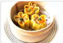
5 SHAOMAI 5PZ 5,50€ ravioli di carne e gamberi