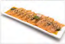
24 CARPACCIO DI SALMONE 8PZ 5,50€