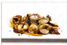
130 SEPIE ALLA GRIGLIA 5,50€