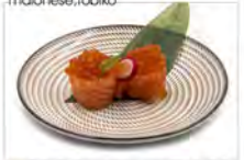
36 SALMONE IKURA 3PZ 5,50€ bigne di riso avvolto in salmone con uova di salmone