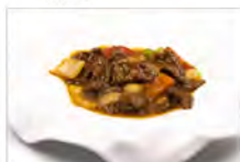
145 MANZO CON CURRY ROSSO 5.00€