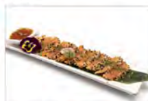
131 TATAKI SALMONE 5.50€ salmone scottato in crosta di sesamo