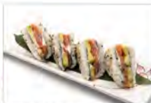
68 SALMONE 5.50€ salmone, avocado, philadelphia