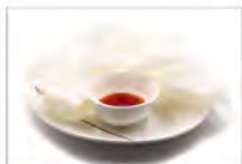
148 NUVOLE DI DRAGO 5.50€