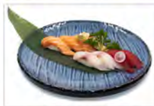
44 SUSHI MISTO 11.00€ 8 nighiri misto