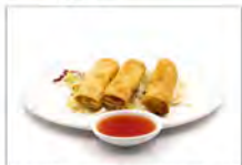
151 INVOLTINI PRIMAVERA 5PZ 5.50€