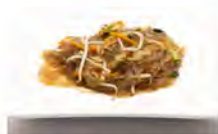
180 SPAGHETTI DI SOIA CON VERDURE 5.50€