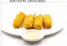
195 FORMAGGIO FRITTO 5,50€