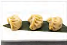
6 GYOSA ALLA GRIGLIA 5PZ 5,50€ ravioli di carne