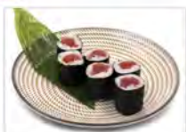
94 TEKKA 5.50€ tonno