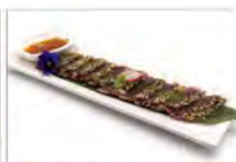
132 TATAKI TONNO 5.50€ tonno scottato in crosta di sesamo