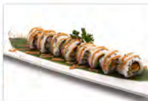
52 CHICKEN ROLL 5.50€ cotoletta di pollo, maionese, insalata, salsa rosa