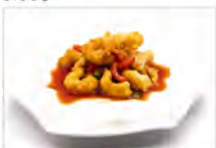
158 GAMBERI IN SALSA AGRODOLCE 5.50€