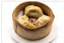
4 GYOSA 5PZ 5,50€ ravioli di carne