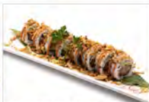
62 CIPOLLA ROLL 5.50€ salmone, avocado, philadelphia, salsa rosa e cipolla