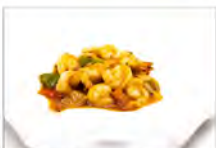
157 GAMBERI PICCANTE 5.50€