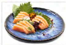
48 SASHIMI DI SALMONE 5.50€