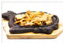
168 MAIALE ALLA PIASTRA 5.50€