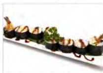
87 EBITEN 5.50€ gambero fritto, maionese, avocado, salsa