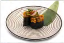
27 GUNKAN SALMONE 3PZ 5,50€ tartare salmone con maionese, salsa piccante,tobiko