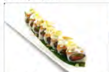
78 SALMON ROLL 5.50€ salmone avocado/ phila e mandorle