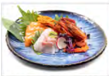
50 SASHIMI SPECIALE 5.50€