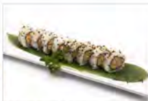
53 CALIFORNIA 5.50€ maionese, surimi di granchio, gambero cotto e tobiko