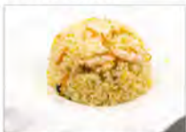
120 RISO SALTATO CON GAMBERI E VERDURE 5.50€