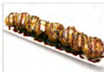
92 FUTOMAKI SPECIALE 5.50€ salmone, philadelphia, tobiko, erba cipollina