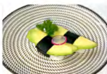
310 AVOCADO 4PZ 5.50€ riso, avocado