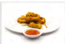
138 TEMPURA IKA 5.50€ anelli calamari fritti