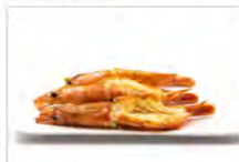
123 GAMBERONI ALLA GRIGLIA 3PZ 5.50€