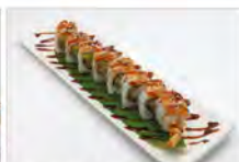
71 FUJI ROLL 5.50€ tempura di gambero, avocado, phila, salmone, salsa