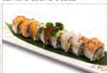
76 RAINBOW 5.50€ surimi, avocado, maionese pesce misto e avocado esterno