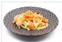
14 INSALATA DI SALMONE 5,50€