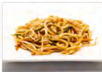
106 YAKI UDON CON VERDURE 5.50€ spaghetti udon con verdure