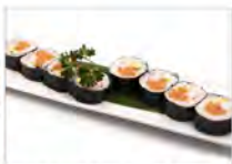
88 SALMONE 5.50€ salmone, avocado surimi