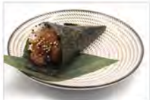
83 SPICY TUNA 5,50 tartare tonno, salsa piccante, tobiko