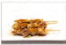
127 YAKI TORI 3PZ 5.50€ spiedini di pollo piccante