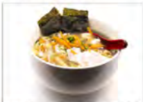
111 RAMEN IN BRODO 5.50€ spaghetti "Ramen" con misto di mare in brodo