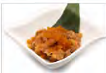
9 SALMONE TARTAR 5,50€