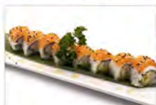
69 CALIFORNIA SPECIALE 5.50€ surimi di granchio, avocado, maionese, salmone esterno