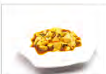
184 DOUFU PICCANTE 5.50€