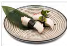
41 TAKO 4PZ 5.50€ polipo