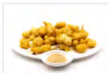
136 TEMPURA TORI 5.50€ bocconcini di pollo