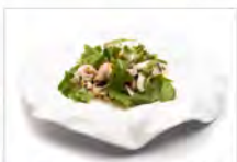
150 ANTIPASTO DI MARE MISTO 5.50€