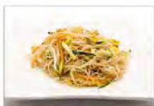
178 SPAGHETTI DI RISO CON VERDURE 5.50€