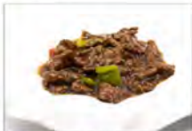
172 MANZO PEPE NERO 5.50€